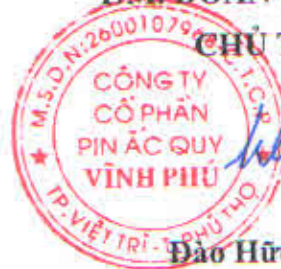
Đào Hữu Uyên