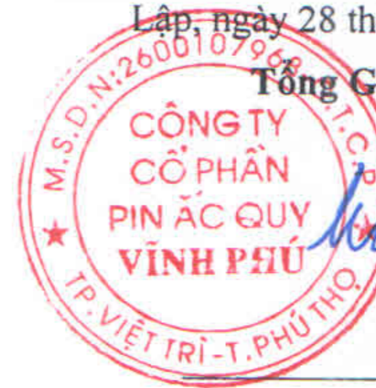
Đào Hữu Uyên