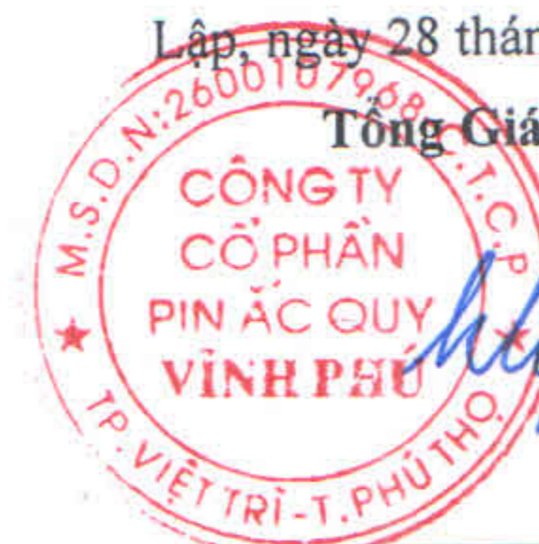
Đào Hữu Uyên